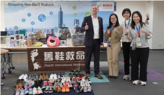
我們將募集到的舊鞋及跳蚤市場拍賣收益捐給「舊鞋救命國際基督關懷協會」。