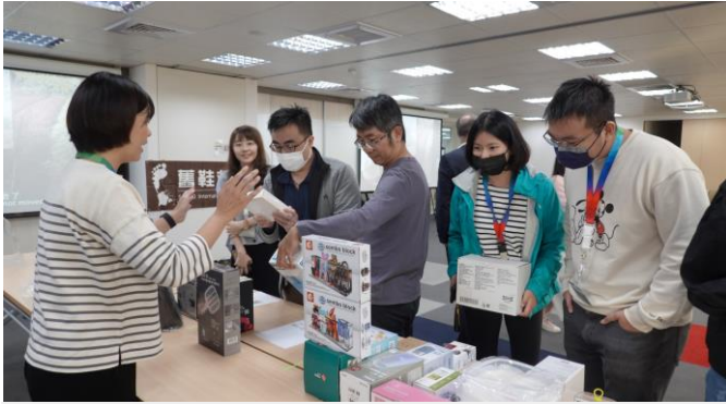
台灣博世舉辦 2024 跳蚤市場，並向同仁募集二手物品及舊鞋。