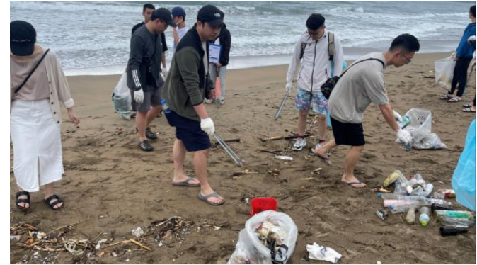
台灣博世志工至新北市萬里海灘淨灘。

為推廣惜物、二手物品回收再利用的觀念，公司舉辦 2024 跳蚤市場，並向同仁募集二手物品及舊鞋；所募集到的舊鞋及跳蚤市場拍賣收益全數捐給「舊鞋救命國際基督關懷協會」，該機構將二手鞋送至東非偏鄉，並支持其在東非的援助計畫。