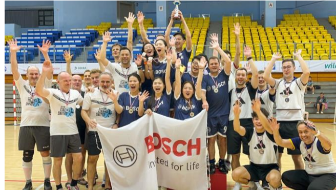
台灣博世榮獲第二屆「德商慈善足球友誼賽」冠軍。

對手、勇奪冠軍！同時，我們也依照踢進的球數捐款給「喜願協會」，幫助重症兒童、持續回饋社會！