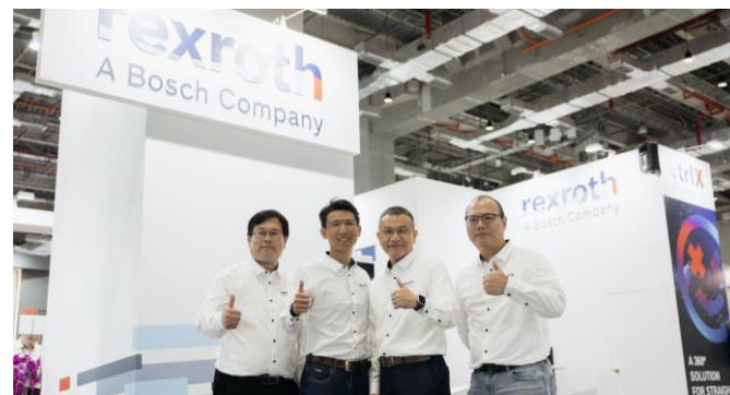
台灣博世力士樂於「2024 台北國際自動化工業展」展出節能的自動化解決方案。