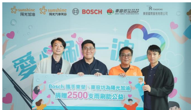
台灣博世智慧交通售後服務捐贈 2,500 組雨刷予陽光基金會。