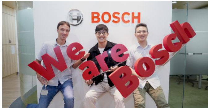
2024 年研發創新獎獲獎團隊。

為強化台灣博世於半導體產業的能見度，2024 年，我們於公司內部成立了半導體領袖俱樂部 (Semiconductor Leadership Club) — 這是台灣博世與德國總部合作的試行專案，希望提升台灣同仁於全球的能見度。透過定期聚會，促進台灣同事與德國總部同事間的交流、資訊交換，並在多元文化的團隊中探索新的職涯或成為領導人的機會。