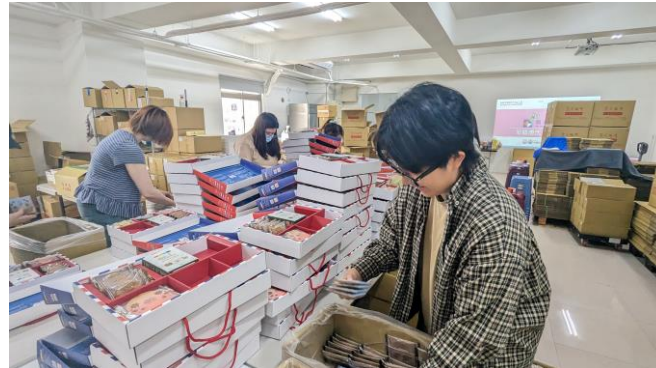
台灣博世志工至唐氏症基金會協助禮盒包裝。

為鼓勵同仁跨出社會參與的第一步，公司自 2018 年開始提供志工假，而後，志工人數便逐年增加。2024 年，台灣博世志工總服務時數近四百小時，其中近七成志工為首次參與活動。2025 年，隸屬博世集團的台灣博世力士樂也將加入「博世成就愛」志工活動。未來台灣博世也將持續擴大志工服務內容的多樣性，鼓勵同仁投入志工活動、與社區共好！