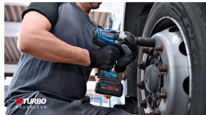
台灣博世電動工具自 2023 年起成為「經濟部機車行低碳補助方案」的合作夥伴。

相較於傳統液壓控制系統，HMC 不僅設計輕巧、低噪音、高效，更滿足快速安裝的需求，節能效率可達 30% 至 80%。