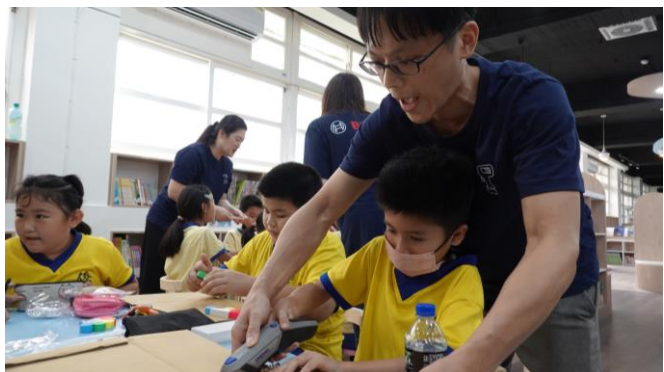
台灣博世電動工具攜手志工於苗栗僑善國小推廣回收再利用的理念。