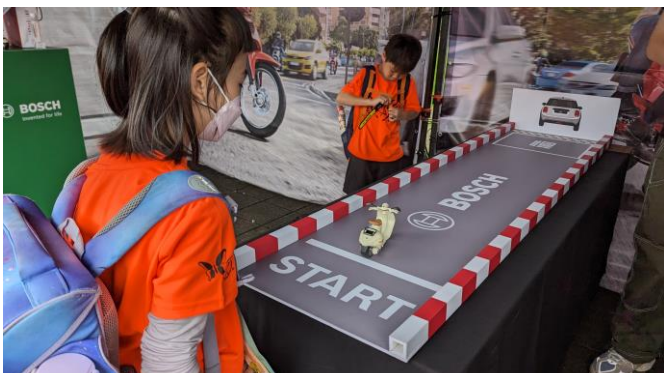
台灣博世原廠汽車零件參加德國交通安全園遊會，推廣機車 ABS 對道路安全的重要性