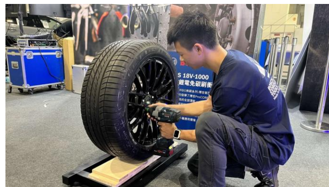
台灣博世贊助第 54 屆全國技能競賽，助力汽車維修人才培育。