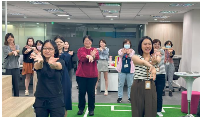
我們舉辦快閃活動，鼓勵同仁離開座位，站起來一起做五分鐘辦公室運動。

為維護員工心理健康，公司舉辦了自我覺察、情緒識別、壓力管理、自我照護及職場倦怠等主題的講座。2024 年，我們也推出促進員工身心健康的心理諮商方案 (Employee Assistance Program, EAP)，提供專業諮商師一對一的心理諮詢，協助管理壓力並應對各種挑戰，支持員工心理健康。