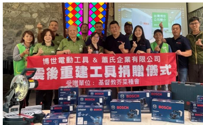
台灣博世電動工具協助花蓮震後重建。