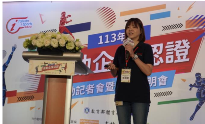
受教育部體育署邀請，台灣博世於運動企業認證記者會上分享如何塑造運動企業文化。