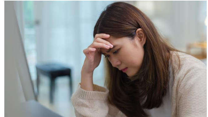
公司為有需要的同仁提供心理諮詢服務。